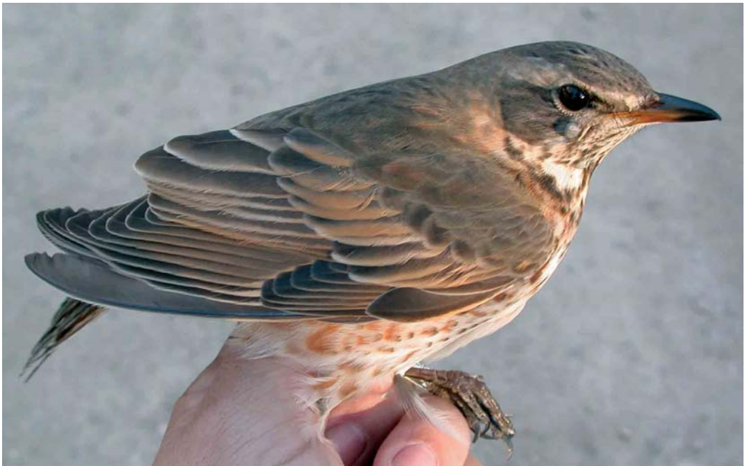
66 Naumann's Thrush / Naumanns Lijster Turdus naumanni , first-winter female, Canal Vell, Ebro delta, Tarragona, Spain, November 2005 (David Bigas)