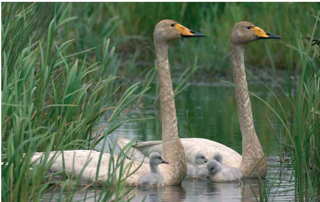
16 Wilde Zwanen / Whooper Swans Cygnus cygnus , Wapserveense Petgaten, Drenthe, 24 mei 2005 (Harvey van Diek) adult vrouwtje (rechts), adult mannetje en vier jongen,