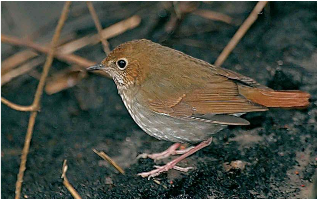
72 Rufous-tailed Robin / Snornachtegaal Luscinia sibilans , Bialystok, Poland, 30 December 2005 (Tomek Kulakowski)