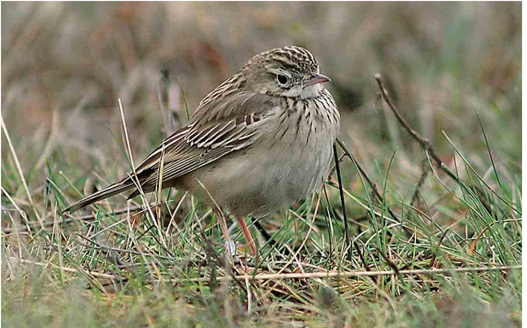
71 Blyth's Pipit / Mongoolse Pieper Anthus godlewskii , Lumijoki Varjakka, Finland, 22 November 2005 (William Velmala) cf Dutch Birding 27: 413, 2005