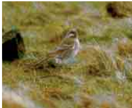
477 Pine Bunting / Witkopgors Emberiza leucocephalos , male, Kooioerdstuifdijk, Ameland, Friesland, 15 March 1998 (Rommert Cazemier)

at Natuurmuseum Fryslân, Leeuwarden), photographed (A Hoekstra; van Dijl & Bosma 2004, Bosma et al 2005; Dutch Birding 27: 316, plate 386-387, 2005); 16-20 November, Beijum, Groningen , Groningen, two, adult male and probably adult female, photographed, sound-recorded, videoed (J G Bosma, R Cazemier, E B Ebels et al; van Dijl & Bosma 2004, Bosma et al 2005, Schoonhoven 2005; Birding World 17: 461, 2004, Dutch Birding 26: 434, plate 612-613, 2004, 27: 74, plate 84, 86, 75, plate 87, 315, plate 385, 318, plate 390-391, 319, plate 392-393, 320, plate 394-395, 321, figure 1-2, 323, plate 396-398, 324, plate 399-401, 326, plate 402, 2005); 16-20 November, Huiswaard, Alkmaar , Noord-Holland, at least one, female-type, photographed (C Seijbel, J Hoedjes; Bosma et al 2005; Dutch Birding 27: 316, plate 388-389, 2005).