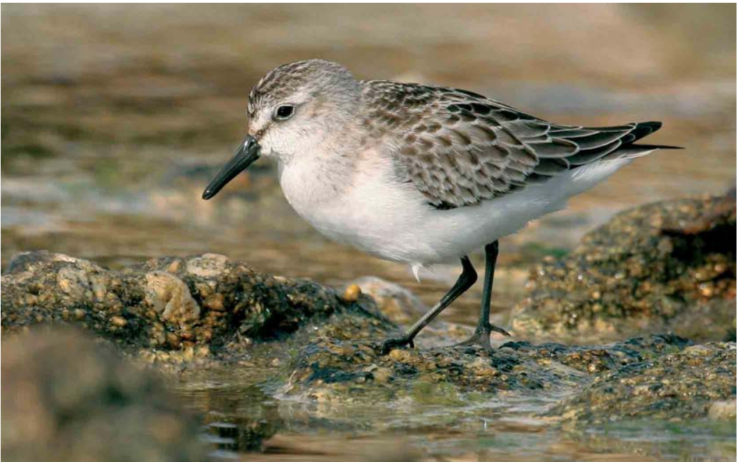
502 Semipalmated Sandpiper / Grijsze Strandloper Calidris pusilla , juvenile, Ouessant, Finistère, France, 26 September 2005 (Aurélien Audevard)