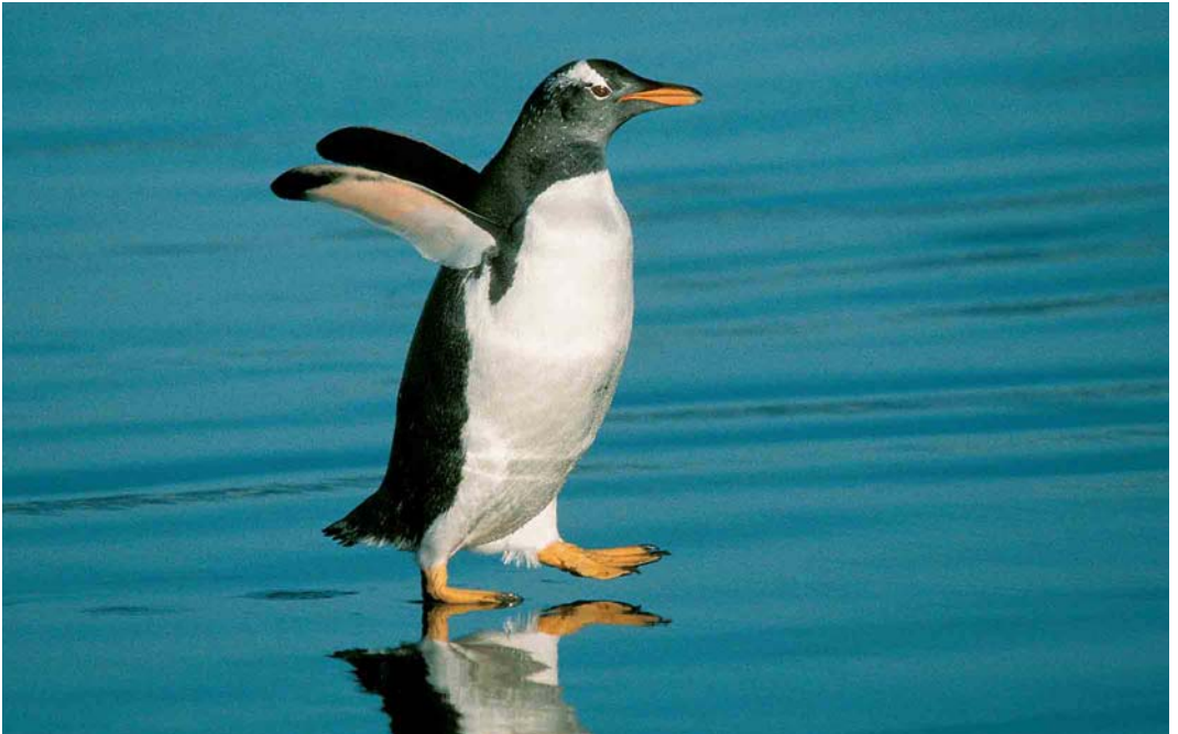
118 Gentoo Penguin / Ezelspinguin Pygoscelis papua , Ratmanoff Beach, Grande Terre, Kerguelen Islands, March 2004