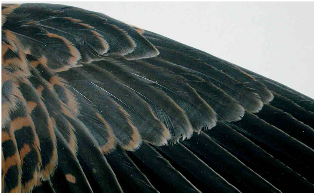
152 Kleine Torenvalk / Lesser Kestrel Falco naumanni , detail van vleugel van eerstejaars vrouwtje (opgeraapt bij Bergen, Noord-Holland, op 5 november 2000), Zoölogisch Museum Amsterdam (ZMA), Noord-Holland, 1 maart 2005 ( Ruud Altenburg ). Let op de ongeklekte zwarte handdekveren / note unmarked black primary coverts. 153 Kleine Torenvalk / Lesser Kestrel Falco naumanni , tenen en nagels van eerstejaars vrouwtje (opgeraapt bij Bergen, Noord-Holland, op 5 november 2000), Zoölogisch Museum Amsterdam (ZMA), Noord-Holland, 28 februari 2005 ( Ruud Altenburg ). Let op de overwegend lichte nagels (bij balgen kunnen de nagels iets donkerder worden dan bij levende vogels) / note largely pale claws (claws may become slightly darker in specimens than in live birds).