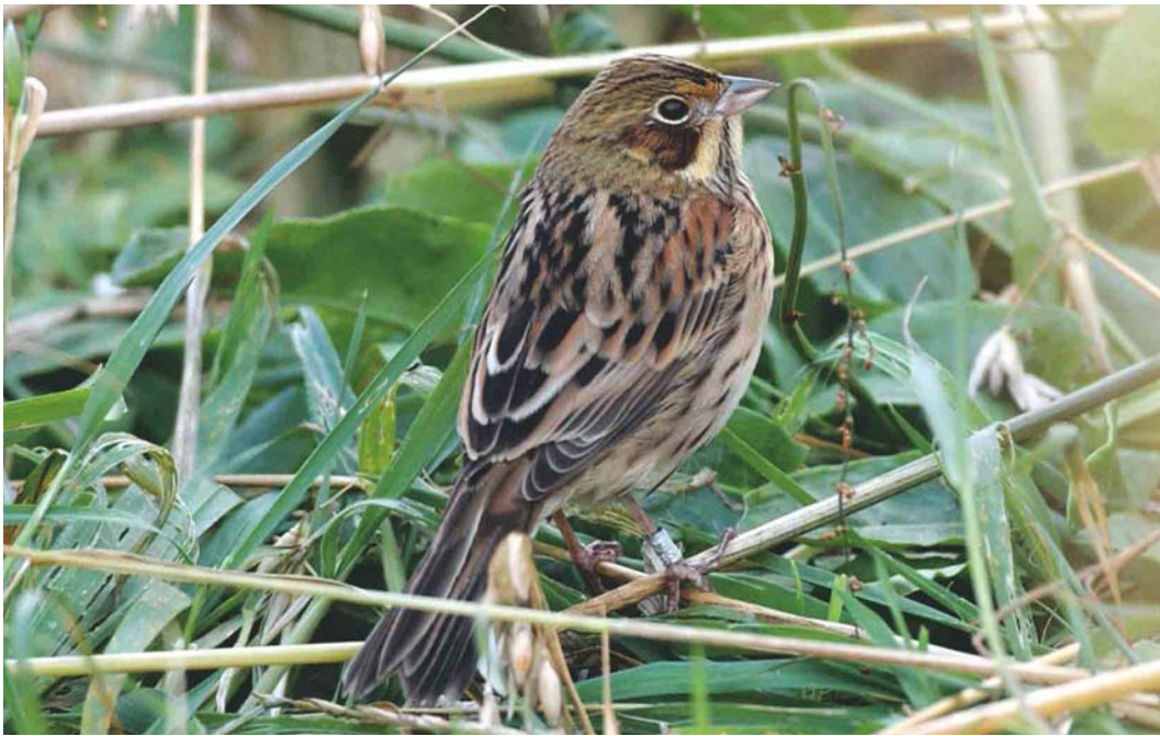
580 Chestnut-eared Bunting / Grijskoppors Emberiza fucata , first-winter male, Fair Isle, Shetland, Scotland, October 2004