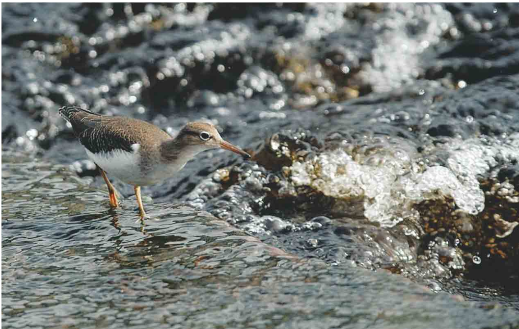
555 Spotted Sandpiper / Amerikaanse Oeverloper Actitis macularius , juvenile, Listowel, Kerry, Ireland, September 2004 (John E Murphy)