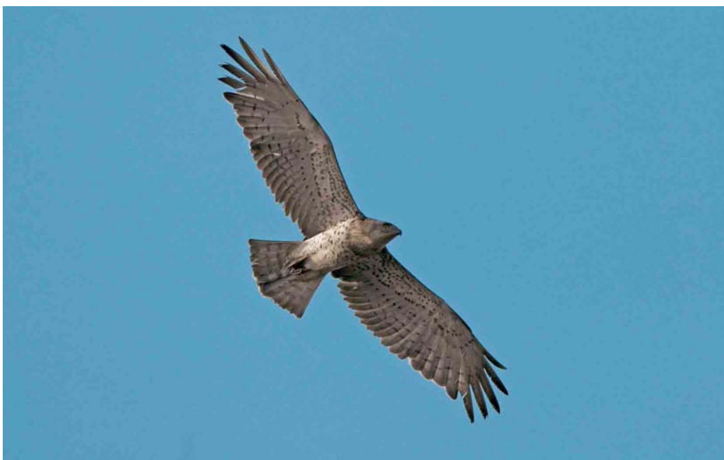
523 Short-toed Eagle / Slangenarend Circaetus gallicus , second calendar-year, De Hamert, Limburg, 14 August 2003 ( Ran Schols )