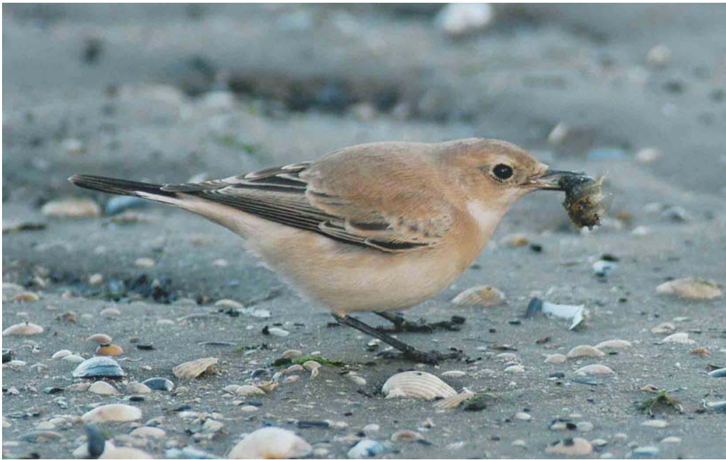
594 Westelijke Blonde Tapuit / Western Black-eared Wheatear Oenanthe hispanica , vrouwtje, Eemshaven-Oost, Groningen, 7 november 2004