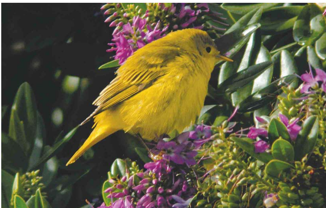
579 Yellow Warbler / Gele Zanger Dendroica petechia , Brevig, Barra, Outer Hebrides, Scotland, 4 October 2004 (Chris Batty)