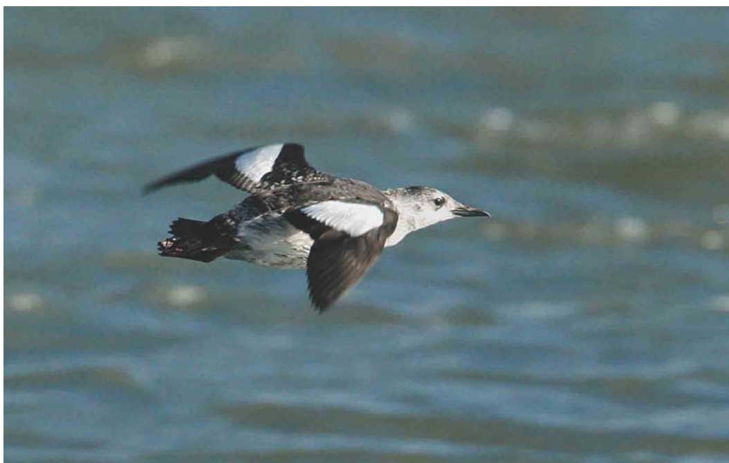
591 Zwarte Zeekoet / Black Guillemot Cephus grylle , adult-winter, West-Terschelling, Terschelling, Friesland, oktober 2004 (Arie Ouwerkerk)