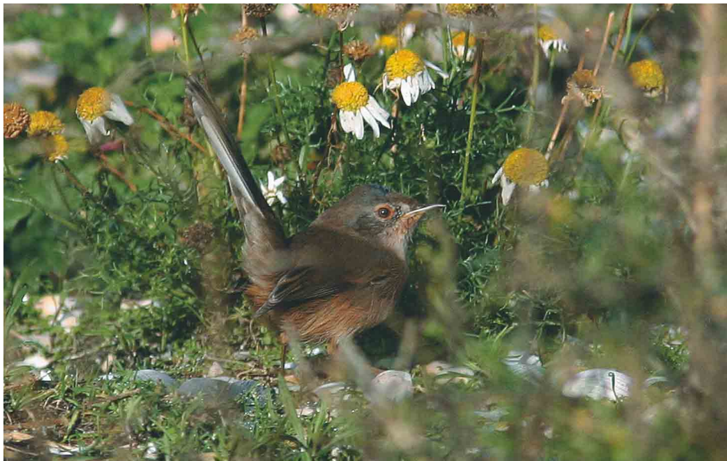
608 Provençaalse Grasmus / Dartford Warbler Sylvia undata , Zeebrugge, West-Vlaanderen, oktober 2004

grote afstand in de vroege uurtjes gezien. Op 3 september pleisterde een Hop Upupa epops in een tuin in Sint-Huibrechts-Hern, Limburg. Er werden 62 Draaihalzen Jynx torquilla doorgegeven, de meeste tussen 1 en 5 september. Op 8 oktober was er na een leegte van enkele jaren weer een waarneming van een Middelste Bonte Specht Dendrocopos medius in Pulderbos, Antwerpen. Vanaf 3 oktober verschenen de eerste Strandleeuweriken Eremophila alpestris maar het bleef telkens bij één tot maximaal acht exemplaren. Grote Piepers Anthus richardi werden vanaf 29 september waargenomen op volgende plaatsen: Essen; Heist (twee); Knokke (twee); Nieuwpoort; Oostduinkerke, West-Vlaanderen; Oudenburg, West-Vlaanderen; Rijkvorsel, Antwerpen; en Tienen (twee). Pleisterende vogels werden weer voornamelijk vastgesteld in het Zeebrugse met c negen in de Achterhaven en drie in de Voorhaven. Er werden nog 47 Duinpiepers A campestris opgemerkt, waarvan 38 tussen 1 en 10 september. De laatste waarnemingen gebeurden in Perwez, Namur, en in Houthalen, Limburg, op 3 oktober. De 11 waargenomen Roodkeelpiepers A cervinus trokken alle langs tussen 13 september en 13 oktober. Op 19 oktober trok een late Gele Kwikstaart Motacilla flava over Tienen. De eerste Pestvogel Bombycilla garrulus trok op 22 oktober over Koksijde, West-Vlaanderen; daarna volgden waarnemingen in Blankenberge op 27 oktober; in Zeebrugge op 28 oktober (drie) en 29 oktober; over Boekhoute op 30 oktober; en over Dilsen-