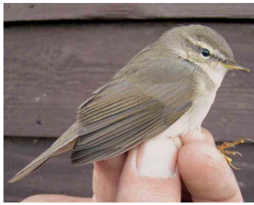
562 Blyth's Reed Warbler / Struikrietzanger Acrocephalus dumetorum , Canal Vell, Ebro delta, Tarragona, Spain, 22 October 2004 563 Eastern Orphean Warbler / Oostelijke Orpheusgrasmus Sylvia crassirostris , first-year male, Sula, Sør-Trøndelag, Norway, 3 October 2004 564 Brown Shrike / Bruine Klauwier Lanius cristatus , Ile de Noirmoutier, Vendée, France, 5 November 2004 565 Pallas's Grasshopper Warbler / Siberische Sprinkhaanzanger Locustella certhiola , first-year, Utsira, Norway, 30 September 2004 566 Dusky Warbler / Bruine Boszanger Phylloscopus fuscatus , Björns fyr, Uppland, Sweden, 2 October 2004. This bird was retrapped on Vlieland, Friesland, the Netherlands, on 12 October. 567 Dusky Warbler / Bruine Boszanger Phylloscopus fuscatus , Kroonspolders, Vlieland, Friesland, Netherlands, 12 October 2004. Same bird as in plate 566!