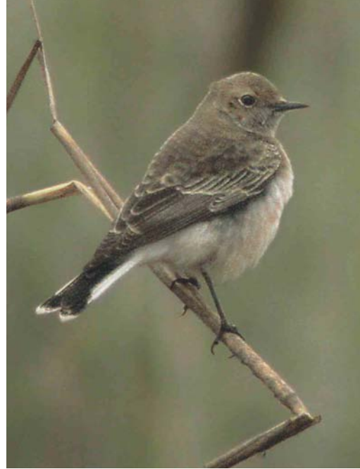
596-597 Bonte Tapuit / Pied Wheatear Oenanthe pleschanka , eerstejaars mannetje, Schiermonnikoog, Friesland, 31 oktober 2004

Zoothera aurea met de eerste op 1 oktober door vele waarnemers bekeken in de Kunstenaarsduintjes bij IJmuiden, en daarna op 3 oktober een overvliegende bij Doornenburg, Gelderland, en een melding op Vlieland, op 4 oktober een vangst op Schiermonnikoog (de volgende dag teruggevangen), en ten slotte op 9 en 10 oktober langsvliegende exemplaren bij Den Haag. Vermeldenswaard is het aantal van ruim 100 000 Koperwieken Turdus iliacus dat op 9 oktober telpost de Nolle bij Vlissingen passeerde. Cetti's Zangers Cettia cetti werden waargenomen tot 17 oktober maximaal twee bij Stellendam, Zuid-Holland, op 13 oktober weer eens bij de Groedsche Duintjes bij Breskens, Zeeland, en op 30 oktober bij Oostvoorne, Zuid-Holland. Vangsten vonden plaats op 4 september in het Verdrongen Land van Saefthinghe, op 9 oktober bij Almere en op 26 september, 27 en 28 oktober en 14 november bij Castricum, Noord-Holland. Tot 19 oktober werden nog 11 Graszangers Cisticola juncidis gemeld. De vijfde Siberische Sprinkhaanzanger Locustella certhiola werd gevangen bij Bloemendaal op 30 september; voor het eerst op een andere ringbaan dan die bij Castricum. Waterrietzangers Acrocephalus paludicola werden gezien op 4 en 5 september bij Katwijk aan Zee, en op 12 september bij Zwolle, Overijssel. Vangsten vonden plaats op 3 september in het Verdrongen Land van Saefthinghe en op 6 september bij Budel-Dorplein, Noord-Brabant. De tweede najaarswaarneming van een Baardgrasmus Sylvia cantillans voor Nederland