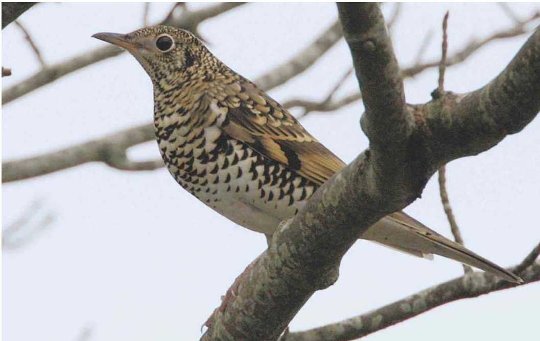
576 White's Thrush / Goudlijster Zosterorhina aurea , Swining, Mainland, Shetland, Scotland, 12 October 2004