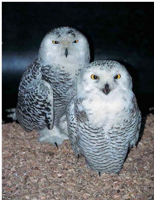
461 Sneeuwuilen / Snowy Owls Nyctea scandiaca (aan land gebracht te Eemshaven, Groningen, op 31 oktober 2001), eerste-winter vrouwtje (links) en eerste-winter mannetje (rechts), vogelopvangcentrum 'De Fûgelhelling', Ureterp, Friesland, 1 november 2001

enkele pogingen worden gevangen door Jaap Poortvliet. De volgende dag is de vogel overgebracht naar het revalidatiecentrum 'De Mikke' in Middelburg, Zeeland. Een nieuwe, zeer licht besmeurde vogel werd op 29 oktober gezien in Aardenburg, Zeeland. Het is lastig na te gaan van welke schepen deze vogels afkomstig zijn. Voor de twee Nederlandse vogels zou dit de Menominee kunnen zijn, maar de mogelijkheid bestaat ook dat ze onopgemerkt zijn meegelift op de Federal Saguenay (die ook Terneuzen passeerde), of mogelijk zelfs nog een ander schip. Beide schepen hebben niet aangemeerd in Felixstowe, dus de Engelse vogel lijkt afkomstig te zijn van een ander schip.