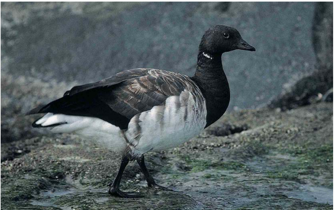
424 Witbuikrotgans / Pale-bellied Brent Goose Branta hrota , adult, Maasvlakte, Zuid-Holland, 10 oktober 2001

KRAANVOGELS TOT ALKEN Er werden 155 Kraanvogels Grus grus gemeld, vrijwel allemaal na 20 oktober. In totaal werden 17 Morinelplevieren Charadrius morinellus gezien, meest in september, met twee late op 25 en 26 oktober op Schiermonnikoog. Amerikaanse Goudplevieren Pluvialis dominicus verbleven van 9 tot 11 september ten noorden van Middelburg, Zeeland,