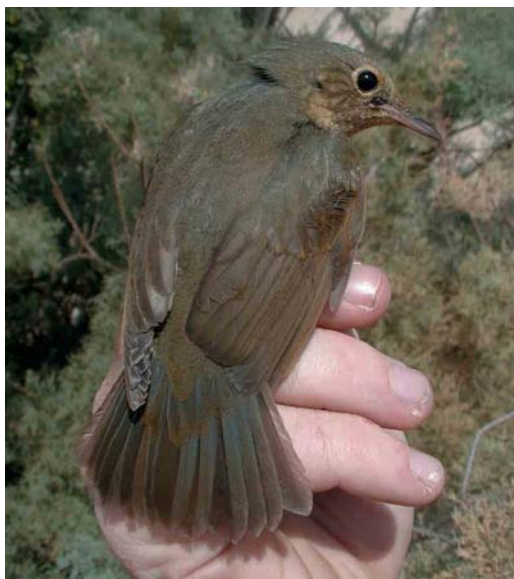
65 Siberian Blue Robin / Blauwe Nachtegaal Luscinia cyane , first-year female, Ebro delta, Catalunya, Spain, 18 October 2000 (Ricard Gutiérrez) cf Dutch Birding 22: 299, 2000

Leaf Warbler P. humei for Norway this autumn (and the seventh ever) turned up at Nærland, Rogaland, on 5-6 November and the fifth at Mølen, Vestfold, on 11-12 November. The ninth (and the first of the autumn) for Denmark at Ribe, Vestjylland, on 15 October was also the earliest ever. On 7-11 November, an influx of seven occurred in eastern Britain; one was at Portland Bill on 4 December. Two were seen in Sweden in November. In Israel, one was territorial at the Eilat cemetery on 10 November. The only one in the Netherlands was found at Oosterscheldekering, Zeeland, on 10 November. During early January, a Dusky Warbler P. fuscatus was still present at Grouville, Jersey, Channel Islands.