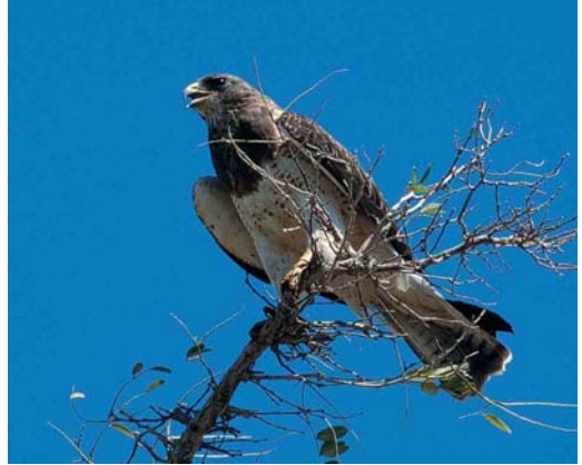
28 Swainson's Hawk / Prairiebuizerd Buteo swainsoni , adult light morph, Antelope Valley, California, USA, 8 August 1998 (Ned Harris). Classic bird with dark head and breast and virtually unmarked belly and underwing-coverts

subterminal band. This adult dark-morph Swainson's Hawk was photographed at Benton Lake National Wildlife Refuge, Montana, USA, in July 1997 by Brian E Small. Another photograph of the same bird in flight appears as plate 27. This bird was identified correctly by 23% of the entrants. The most mentioned incorrect answers were Long-legged Buzzard (33%), Common Buzzard (25%, including Steppe Buzzard) and Booted Eagle (8%).