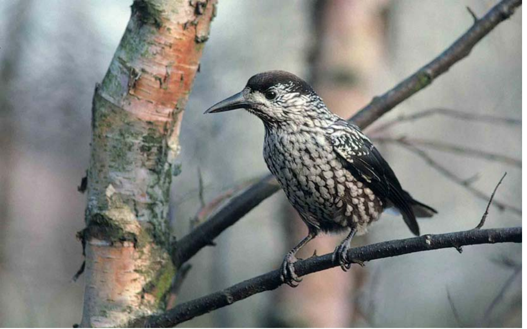
56 Notenkraker / Spotted Nutcracker Nucifraga caryocatactes , Terschelling, Friesland, 2 december 1999