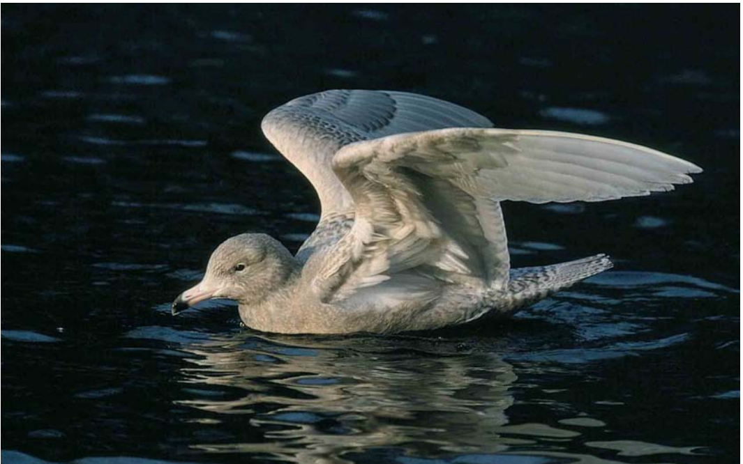
53 Grote Burgemeester / Glaucous Gull Larus hyperboreus , eerste-winter, Rotterdam, Zuid-Holland, 25 januari 2000 (Marten van Dijl)