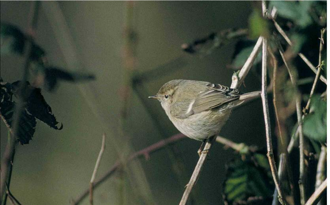
57 Humes Bladkoning / Hume's Leaf Warbler Phylloscopus humei , Jollema, Terschelling, Friesland, 15 januari 2000