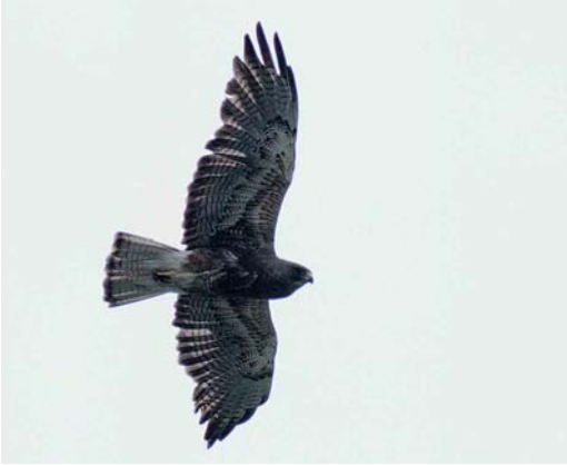
27 Swainson's Hawk / Prairiebuizerd Buteo swainsoni , adult dark morph, Benton Lake National Wildlife Refuge, Montana, USA, July 1997. Same individual as original mystery bird. Note wing shape, contrasting white vent and undertail-coverts and well-demarcated dark trailing edge to wings and tail