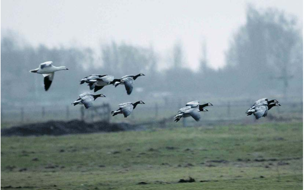
49 Ross' Gans / Ross's Goose Anser rossii , adult, met Brandganzen / Barnacle Geese Branta leucopsis , Oude Land van Strijen, Zuid-Holland, 9 februari 2000 (Marten van Dijl)