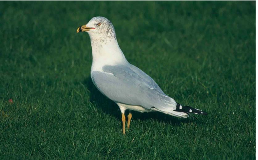
55 Ringsnavelmeeuw / Ring-billed Gull Larus delawarensis , adult, Goes, Zeeland, 21 november 1999