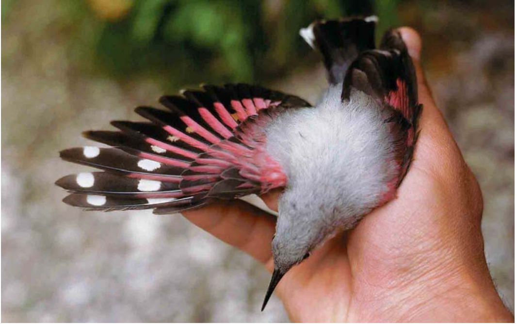
167 Wallcreeper / Rotskruiper Tichodroma muraria , female, Malá Fatra mountains, Slovakia, 2 July 1991

with spread wings and is blown upwards, almost without moving the wings. It especially shows its extraordinary agility and manoeuvrability when attacked by aerial predators like Eurasian Sparrowhawk Accipiter nisus , Common Kestrel Falco tinnunculus , Eurasian Hobby F subbuteo or Peregrine Falcon F peregrinus . It flutters about wildly in all directions close to the rock face, thus evading attack (figure 3). The species also shows extraordinary manoeuvrability in aerial tussles of rivals or when male and female flutter about each other when they happen to meet in the vicinity of the nest.