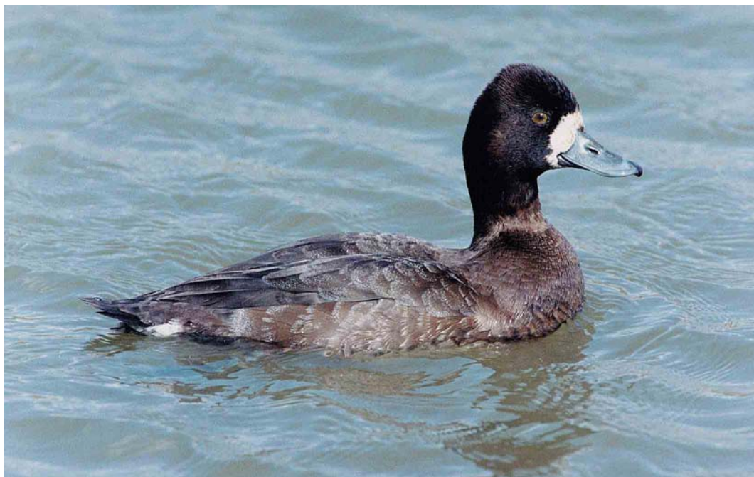
176 Lesser Scaup / Kleine Topper Aythya affinis , Cleethorpes, Lincolnshire, England, April 1999

and at least four in Belgium (where also four pulli were ringed at Brecht, Antwerpen). The second singing in Britain this century was at Grove Ferry, Kent, from 6 June onwards. The first sound-recorded in Portugal was at Lagoa dos Patos, Ferreira do Alentejo, on 5 June. At the Kizilirmak delta, confirmation of the presence (and breeding) of Grey-headed Swamp-hen Porphyrio poliocephalus on the Turkish Black Sea coast was provided by the observation of an adult with two fledged young on 27 June. The second American Coot Fulica americana for Britain was photographed at South Walney, Cumbria, on 17 April.