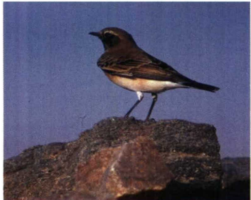
136 Pied Wheatear / Bonte Tapuit Oenanthe pleschanka , male, Cape Kaliakra, Bulgaria, 15 May 1994 (Leo J R Boon) 137 Cyprus Pied Wheatear / Cyprustapuit Oenanthe cypriaca , male, Akyatan Gölü, Adana, Turkey, 25 March 1987 (Arnoud B van den Berg) 138 Pied Wheatear / Bonte Tapuit Oenanthe pleschanka , first-summer male, Eilat, Israel, 1 April 1993 (Leo J R Boon) 139 Pied Wheatear / Bonte Tapuit Oenanthe pleschanka , first-summer male, Eilat, Israel, 1 April 1993 (Leo J R Boon) 140 Cyprus Pied Wheatear / Cyprustapuit Oenanthe cypriaca , first winter, Abu Simbel, Egypt, 31 January 1993 (Leo J R Boon) 141 Cyprus Pied Wheatear / Cyprustapuit Oenanthe cypriaca , first-winter male, Eilat, Israel, 6 October 1992 (Leo J R Boon)