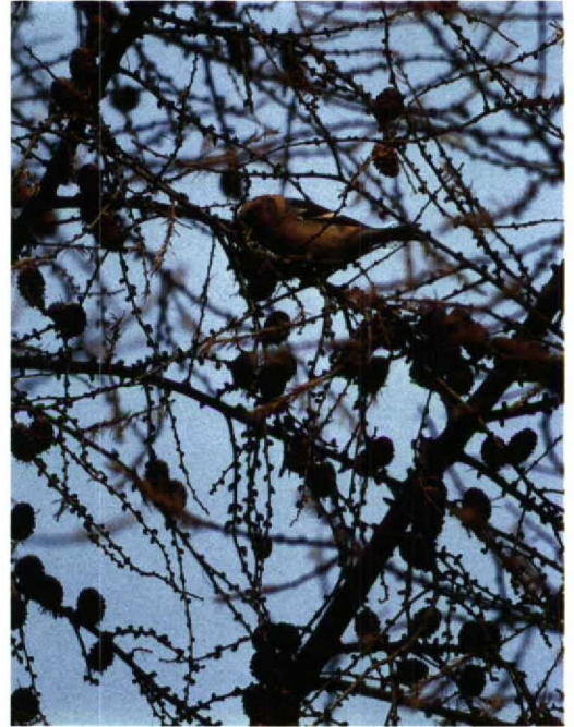
28 Roodhalsgans / Red-breasted Goose Branta ruficollis , Den Bommel, Zuidholland, december 1993 (Marten van Dijl) 29 Witbandkruisbek / Two-barred Crossbill Loxia leucoptera , Baarn, Utrecht, 29 november 1993 (Hans Gebuis) 30 Waterspreeuw / Dipper Cinclus cinclus , Norgerhaven, Drenthe, oktober 1993 (Rudy Offereins)