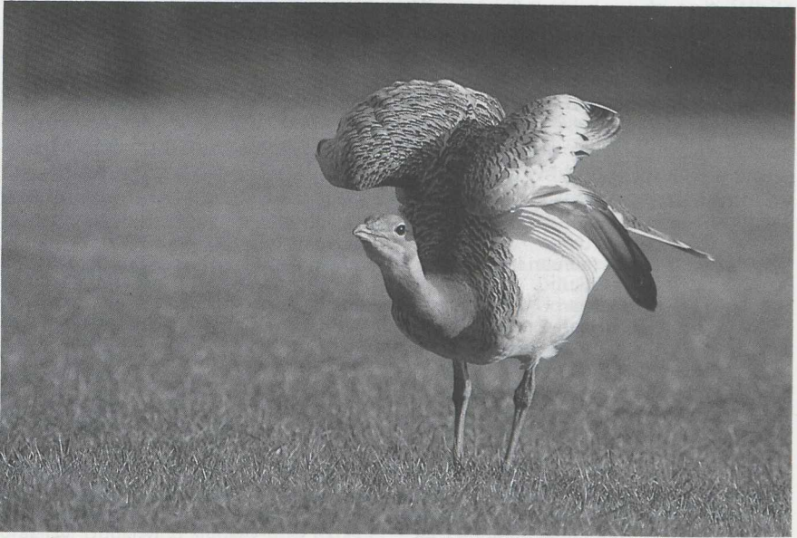
42-43 Grote Trap Otis tarda , Teuge, Gelderland, januari 1985 (René Pop).