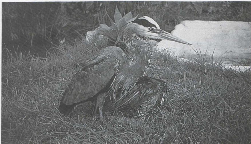
41 Great Blue Heron Ardea herodias , Azores, April 1984 (Fátima Le Grand).

c 10 Great Blue Herons were observed on the Azorean islands of São Miguel, Pico and Faial. They had lost all sense of fear and seemed exhausted. One had paint on its back which analysis proved to be anti-rust red-lead paint. It was stuck all over its back and secondaries and prevented it from flying any great distance. Three other birds (two on São Miguel, one on Faial) had machine grease sticking to their feet. It is assumed, therefore, that these birds' passage to the Azores had been ship-assisted. Enquiries at the vessels moored in the three main ports in the Azores yielded no new information. On dissection, the three specimens proved to be adults completely lacking fat deposits. The measurements given in table 1 would suggest that these birds belong to the migratory subspecies A h herodias from north-eastern North America which migrates to Central and northern South America (cf Palmer 1962).