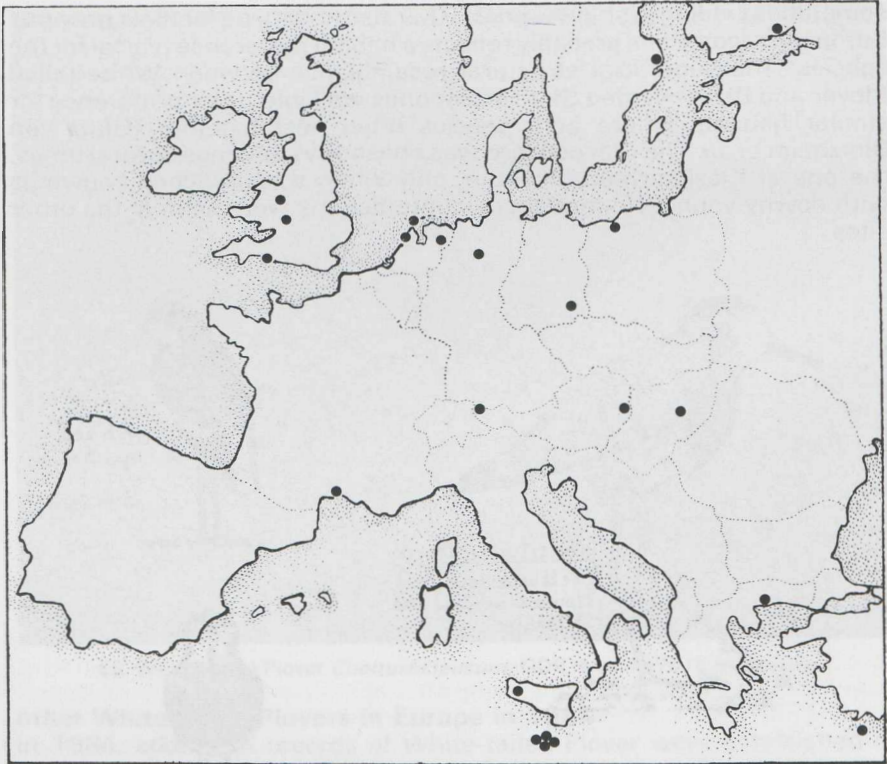
FIGURE 2 Distribution of White-tailed Plover Chettusia leucura records in Europe up to and including 1984.