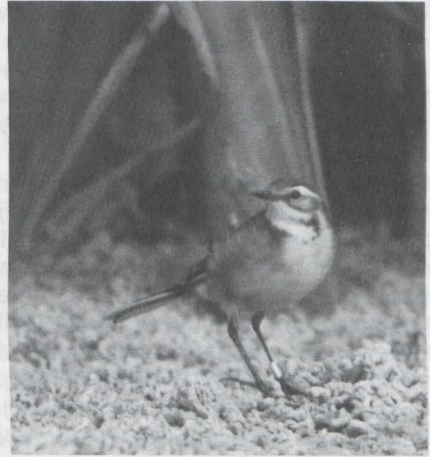
107-108 Citroenkwikstaart Motacilla citreola , Castricum, Noordholland, september 1984.

GEDRAG Rustig foeragerend zonder sprintjes en sprongetjes, en vliegende insecten niet achtervolgend. In tegenstelling tot Witte Kwikstaart M. alba en Gele Kwikstaart gewoonlijk in dichte vegetatie vertoevend; na loslaten sluipend tussen lage braam- en kruipwilgbegroeiing foeragerend, later in dichte lisdoddevegetatie langs oever verblijvend en herhaaldelijk op drijvende velden darmwier foeragerend. Soms met staart kwikkend. Af en toe vleugels afhangend en kruin opzettend (vaak gevolgd door zich uitschudden en veren rangschikken).