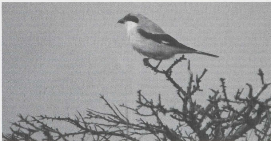
43 Lesser Grey Shrike Lanius minor , Terschelling, Friesland, September 1982 (Eric Bos).